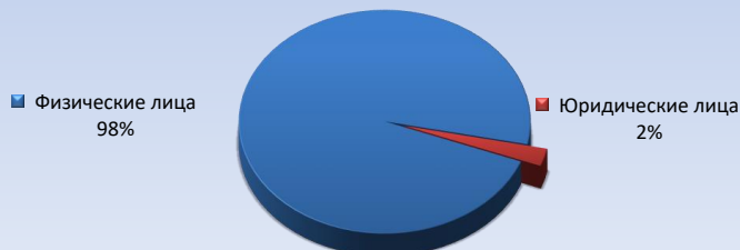
Тип заявителя :